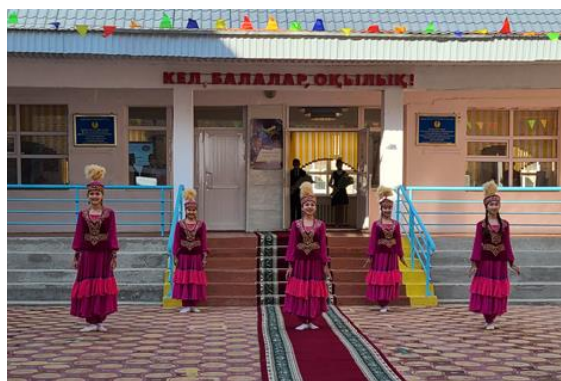
Казахский народный танец в исполнении детей

Директор школы рассказывает о программе «Корни травы»