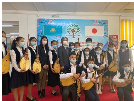
Памятное фото с учениками