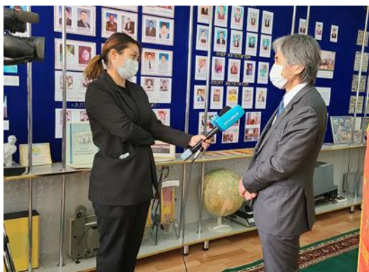
Посол Ямада дает интервью

Баннер в честь окончания программы «Корни травы»