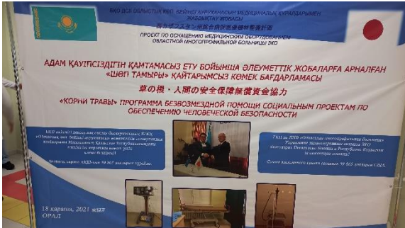
Баннер в честь церемонии завершения