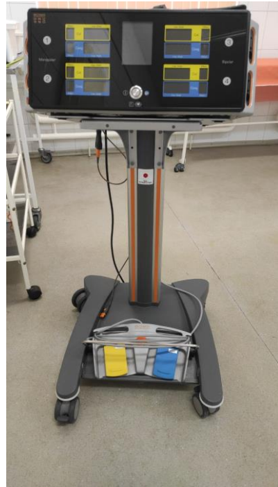
Предоставленное в рамках проекта оборудование