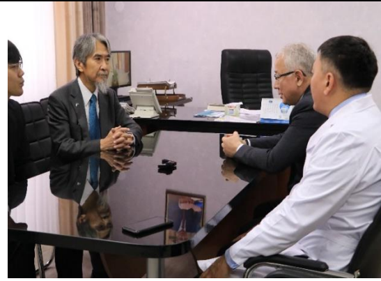
院長と保健局長と会談している様子。