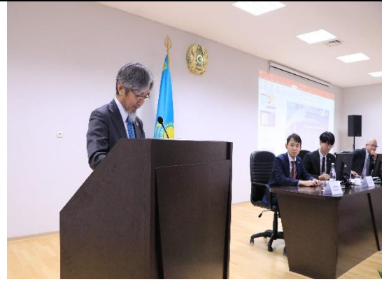
完了式での大使のスピーチ。