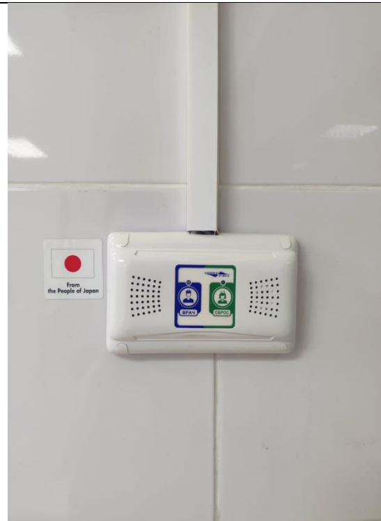
ナースコールシステム。