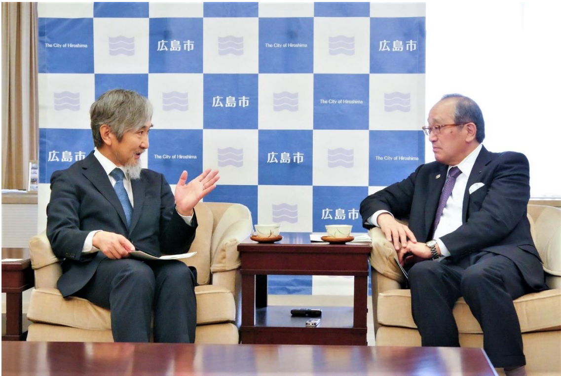
松井一實市長表敬