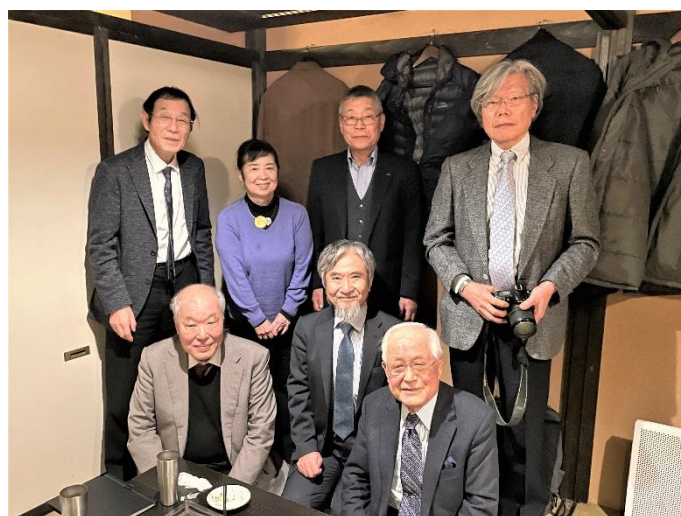
外務大臣表彰を受けたセミパラチンスク医療協力関係者