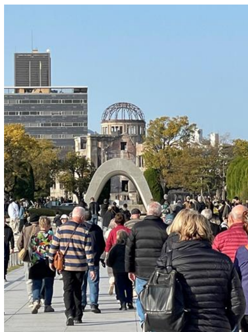
海外からの来訪者（G7 広島サミット後急増）